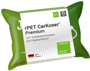
Ansicht der fertigen Banderole